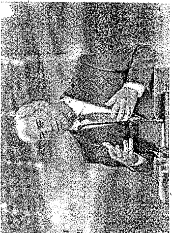
CIRO não gosta que perguntem a ele sobre 2º turno

(candidato do PDT ao Governo do Ceará), que é o melhor cara, que é meu candidato a governador lá. Isso dói demais em um cara, mas é assim”, afirma ainda.