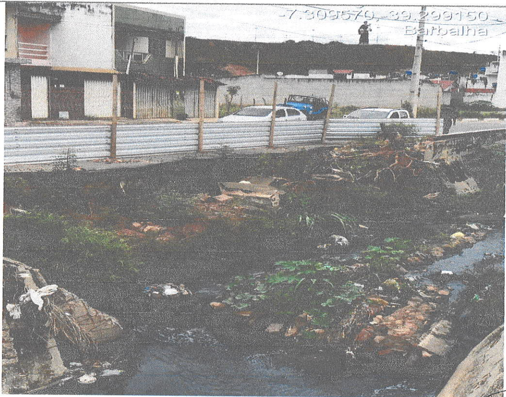
26 e 27 – Paredes, calçadas e asfalto destruídos.