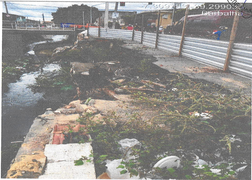
28 – Parede, calçada e asfalto destruídos