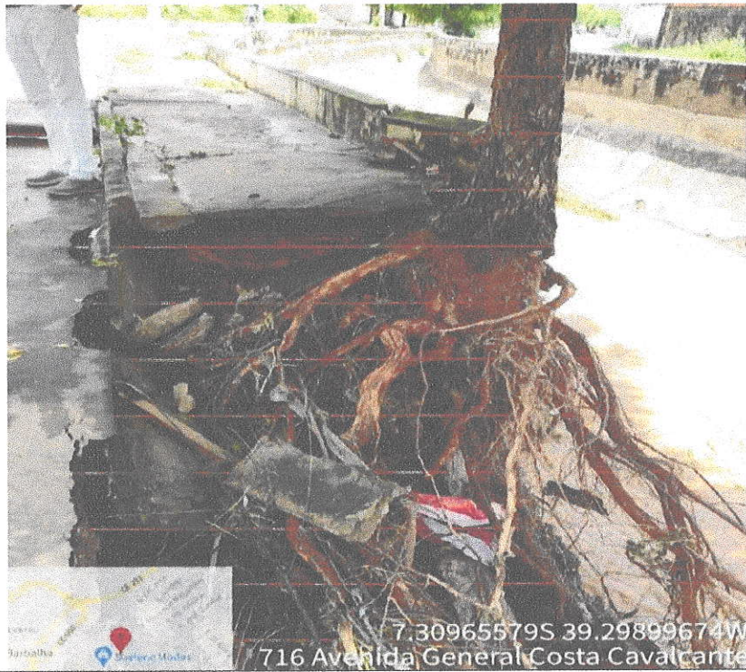
Parede do canal que desabou com a energia da água. DATA: 13/04/2022