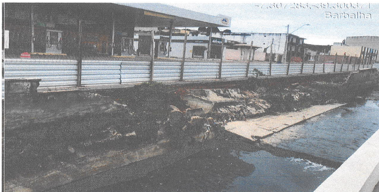
01- Parede do canal e calçada lateral destruídas.

Meta 4: CANAL RIACHO DO OURO – AV. COSTA CAVALCANTE, CENTRO