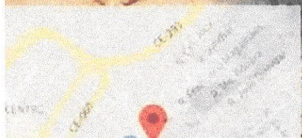
Legenda: FOTO CANAL RIACHO DO OURO