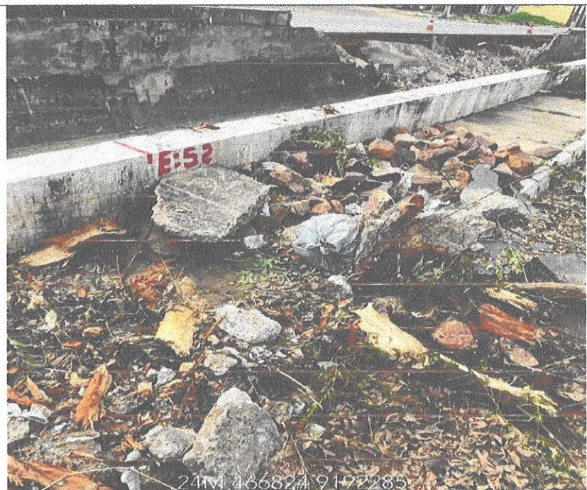
Avenida Costa Cavalcante ficou parcialmente bloqueada dado o volume do material carreado pela água. DATA: 13/04/2022