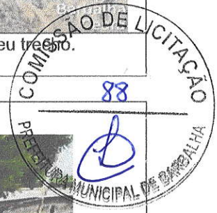
Avenida Costa Cavalcante ficou com o pavimento asfáltico danificado em parte do seu trecho. DATA: 13/04/2022