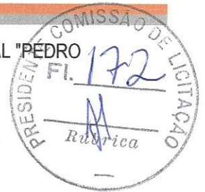
TABELA 024.1 - SEINFRA - CEARÁ - DESONERADA

TABELA UTILIZADA "SINAPI 2016" Sistema Nacional de pesquisas de custos e índices da Construção Civil.