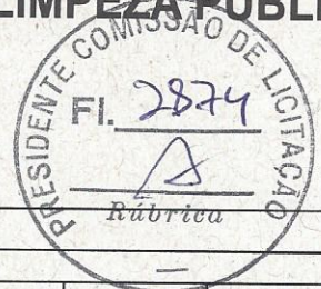
TABELA: SEINFRA 24.1 DESONERADA