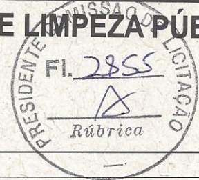
TABELA: SEINFRA 24.1 DESONERADA