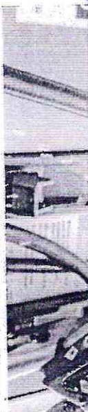
BAIXA no preço do dólar não tem contido alta da gasolina

Na semana imediatamente anterior, o preço médio no Estado era de R$ 5,74, mas podia oscilar entre R$ 5,39 e R$ 5,99. Há quatro semanas esses valores